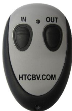
Afbeelding 1 SKX1WD heeft 1 knop