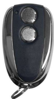
Oude handzender Apache TC2-80

Door leveringsproblemen bij de producent zijn de Apache handzenders niet meer leverbaar. Daarom is HTC overgestapt op andere standaard handzenders.