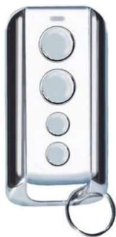
Nieuwe handzender Prastel Slim 4E