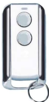
Nieuwe handzender Prastel Slim 2E