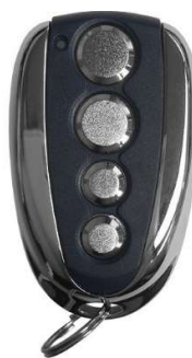
Oude handzender Apache TC4-80